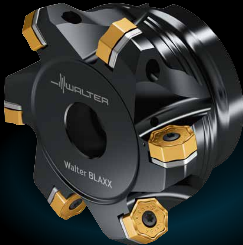
Walter BLAXX Heptagon-Fräser M3024, Ø 80 mm mit XNMU070508-F57 WKP35G

Erleben Sie eine neue Technologie-Plattform, die mit einer einzigartigen Beschichtung glänzt: Tiger-tec® Gold Erfolgreiche Unternehmen setzen seit Jahren auf Walter Werkzeugsysteme. Jetzt machen sie gemeinsam mit Walter den nächsten Schritt.